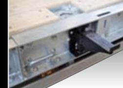
Zurrösen/-ringe zur Ladungsicherung und Ausleger zur Verbreiterung