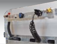
Elektro- und Luftanschlüsse am Hochbett