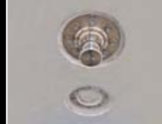
Versetzbarer Königszapfen für Zwei- und Dreiachs zugmaschinen geeignet

Erstmals präsentiert Humbaur seine Weltneuheit: Den Tieflader Sattelaufleger HTS – hier auf der BAUMA 2010!